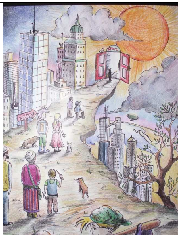
Tus és ceruza technika Vajda Gyula Pogány Frigyes Kéttannyelvű Építőipari Szakközépiskola és Gimnázium